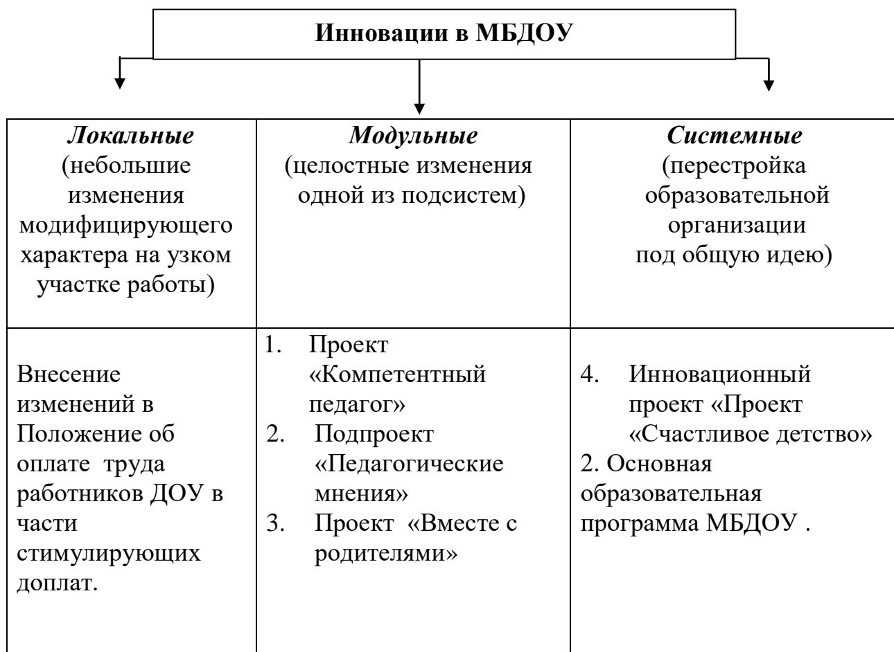
Рис. 2. Система инноваций в МБДОУ

Под инновациями мы понимаем актуально значимые и системно самоорганизующиеся новообразования, возникающие на основе разнообразия инициатив и новшеств. Опираясь на качественные характеристики новшеств, предложенные В.С. Лазаревым, рассмотрим систему инноваций в МБДОУ, представленную ниже на рис. 2